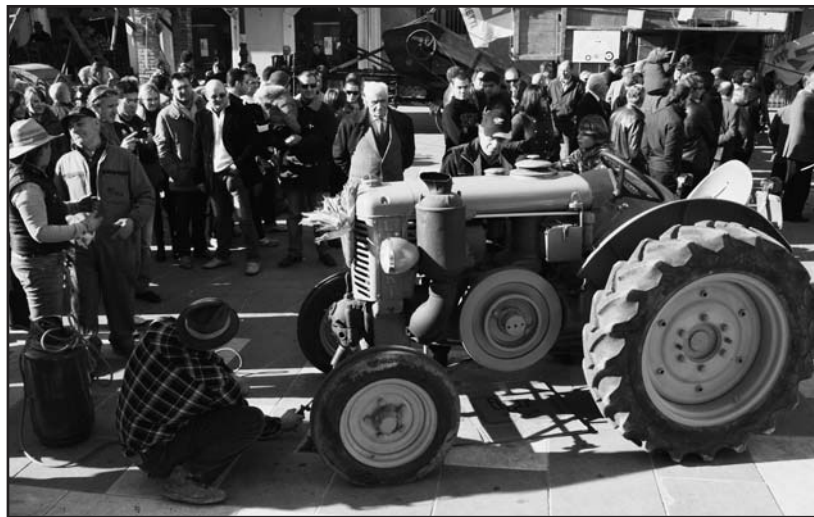
Vecchi trattori: è il momento di "scaldare la testa".

Ore 11,15 - ritorno ai Trivellini transitando per il centro storico e Novagli.