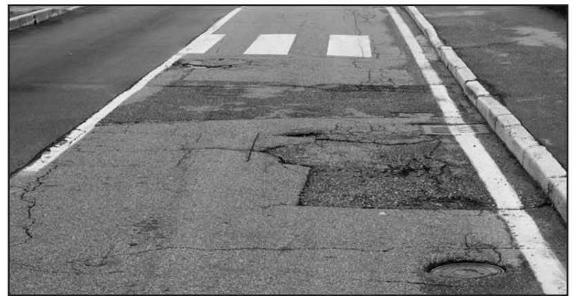
Il tratto di via C. Battisti da asfaltare.