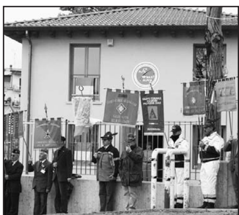
Gagliardetti in alto all'alzabandiera.

Pulizie di: CONDOMINI UFFICI CANTINE GARAGE APPARTAMENTI ed altro antoatna@libero.it 334 1123571 338 2085224