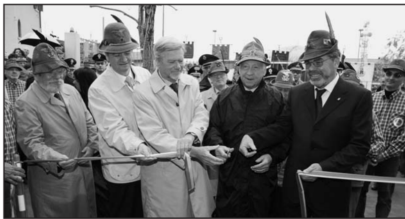
Il taglio del nastro con il sindaco e le massime autorità dell'Associazione Alpini.

Anche il Presidente provinciale ha fatto eco ai risultati positivi che l'impegno tenace e sempre vivo degli alpini riesce a raggiungere anche a favore della comunità.