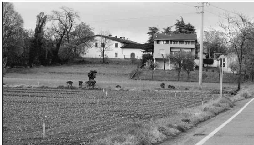
L'area interessata dal nuovo svincolo di via Fracassino e via Cerlongo.

Fra quelle che abbiamo segnalato più volte, e che è diventata un problema molto serio, è sicuramente la "tangenziale" a nord del paese in località ferriera: inserita come nuova strada nel PRG del maggio