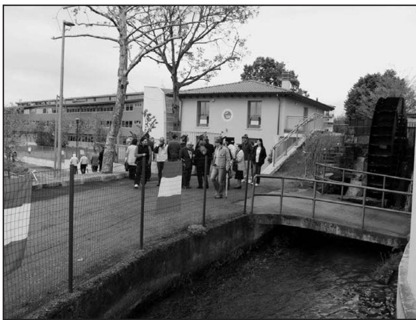
La "Casa dell'alpino", nuova sede del Gruppo Alpini di Montichiari. Sulla destra la ruota ancora funzionante del vecchio Mulino di Sopra.

siero pungente del ritorno a casa il denominatore comune, con il senso del dovere che rende pronti al sacrificio, con l'amore e la nostalgia per il proprio paese.