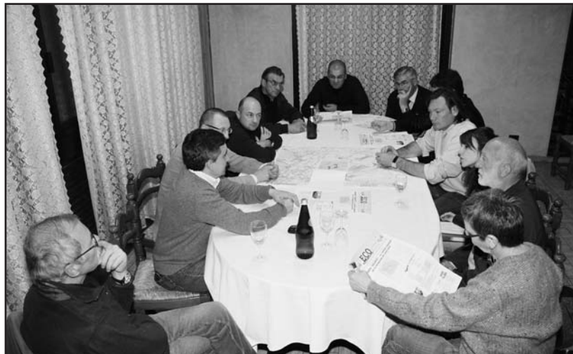
Una riunione del Comitato "DECIDETE!!" per l'esame dei vincoli aeroportuali.

La Regione Lombardia è stata sollecitata a decidere in fretta ed a svincolare gran parte delle aree con una assurda delimitazione di 48 kmq. Sarà molto importante l'Assemblea che si terrà in zona